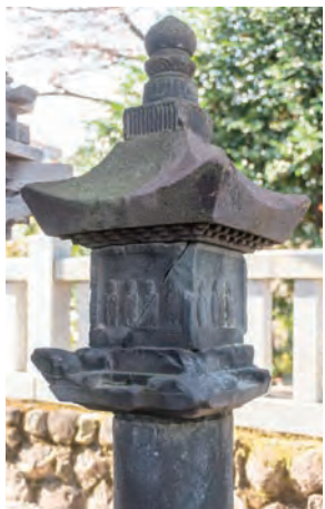
◀東向八幡宮の石幢

また、鍛冶町通りにある「東向八幡宮」は、長野業尚公が1474年（文明6）に山城国（京都府）清水八幡宮から勧請創建し、箕輪城総鎮守として祀ったと伝わる。本殿北側にある石幢には「文明6年」の銘がある。石上寺の石幢にも同様の年号が刻まれており、専門家によると、箕輪城築城の年が1474年、あるいはそれ以前であると推測する根拠の一つになっているという。