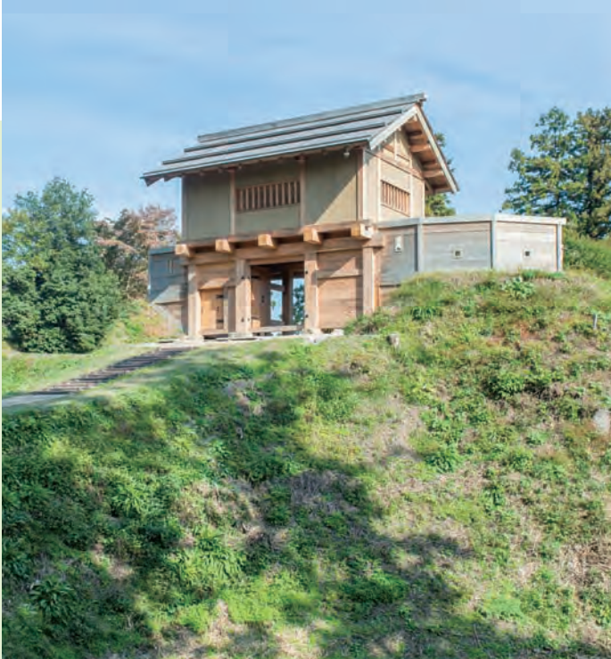
城門「郭馬出西虎口門」の復元

直政公によって埋め立てられた大堀切が、底の杉を伐採し9メートル程の深さまで再現されている。実際は20メートルほどの深さがあり、全国級のスケールという。