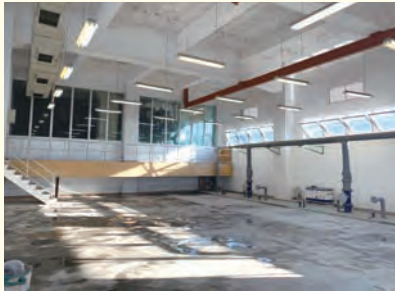
阿久津水処理センターがサイバー捜査室(上)に