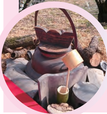
箕輪城跡では、関ヶ原の戦い以前の城郭から、関東では初となる茶碗が出土している。茶の湯に親しんだ暮らしがうかがえる。

咲く花の王。気品があり高潔なことから君子にたとえられ、菊・竹・蘭と並び「四君子」と呼ばれています。箕郷では、養蚕が衰退した後、梅が農家の貴重な収入源となり、りっぱな梅林を育んできました」と話すのは、3月1日から3月下旬まで箕郷梅