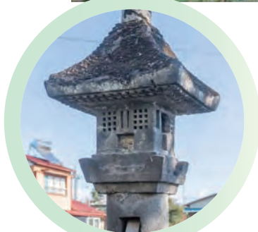
▲石上寺の輪廻の塔