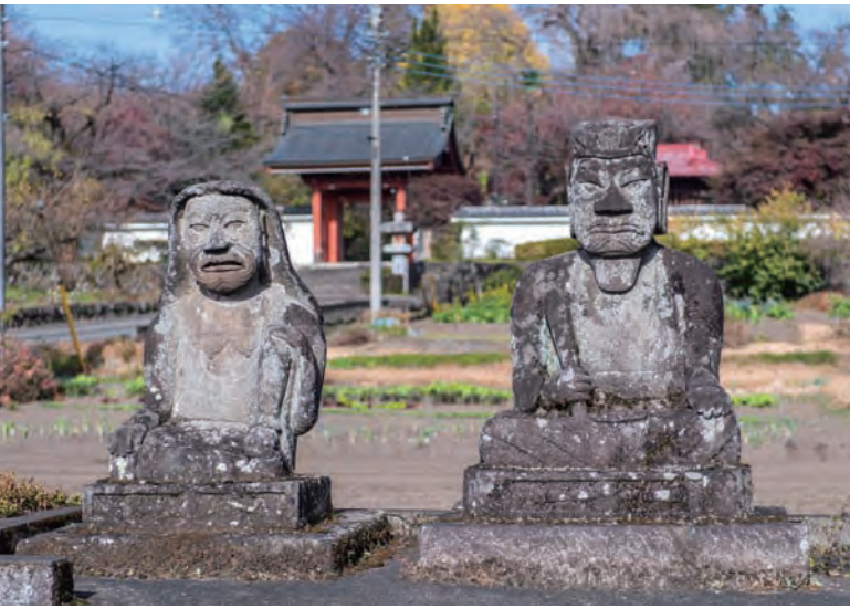
ユニークは姿の石像は右側が閻魔大王、左側が奪衣婆（三途河〈葬頭河〉の婆などと呼ばれ、三途の川で亡者の衣服をはぎ取る老婆の鬼のこと）

周囲の梅が開花期を迎えると、長野氏の家紋「梅扇」が刻まれた山門がひとときわ輝く。参道の前のユニークな2体の石像を手前に山門を眺めるのが、絶好のビューポイントだ。