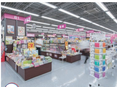
LABI1 日用品や書籍コーナー

ドラッグ、冷凍食品、菓子類などの生活関連商品が揃う。書籍、ギフト、ゴルフ用品など、日々の暮らしに欠かせない商品が豊富だ。ヤマダのポイントカードが使えるので、メンバーならさらにお得。「お客様の来店頻度を高める」という点でも効果的だ。 地下1階の片隅にあるゴルフコーナーには、昼休みを利用して訪れる男性サラリーマンの姿が目立つ。ここは、グリップやシャフトの交換などの修理や調整をする工房と試打室を併設している。休日は家族サービスに忙しいお父さんたちが、たとえわずかな時間でも誰にも気兼ねなく好きなことに没頭している姿が微笑ましい。