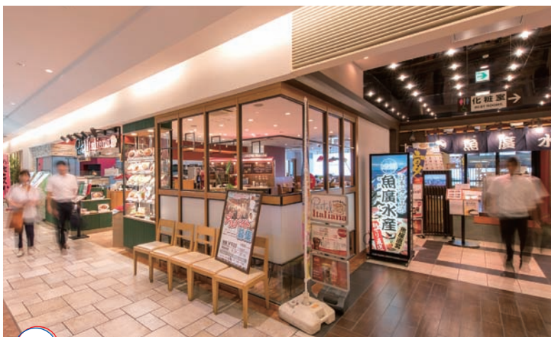
LABI1 5階の飲食店街「ラビタカサキダイニング」

また、未就学児向には柔らかな素材で囲まれたプレイコーナー「遊キッズ愛ランド」（土日は1時間500円、20分300円。平日は時間無制限で500円。同伴者は無料）の利用がおススメ。遊具がふわふわで怪我の心配もなく、小さな子どもたちも体を使つて思い切り遊べそう。たくさん動いて眠くなつた