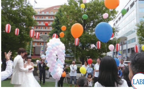
LABI Garden でのイベント風景