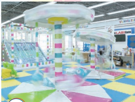
LABI1 遊キッズ愛ランド