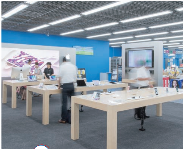
LAB11 情報通信機器コーナー

花道といったところ。高画質な4Kテレビ、しかも大型となれば、ため息が出るほどきれいな映像と大迫力の臨場感があり、ハイビジョンでは難しかった暗いシーンの質感、空気感は観る者にさらに感動を与える。従来のテレビと比較できるよう新旧のテレビが隣り合わせに並べられ、その違いは一目瞭然だ。こんな液晶大画面が自宅の壁を占領したら、毎日が美しい映像美に彩られ、週末はホームシアターさながらに、迫力のアクション映画なども堪能できるし、ビールを片手にスポーツ観戦もいい。最新のテクノロジーはいつの時代も人々を高揚させ感動をもたらしてくれる。