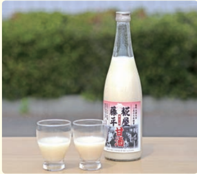
株式会社 糀屋 / 問屋町店：高崎市問屋町 2-10-4 元紺屋町店：高崎市元紺屋町 13