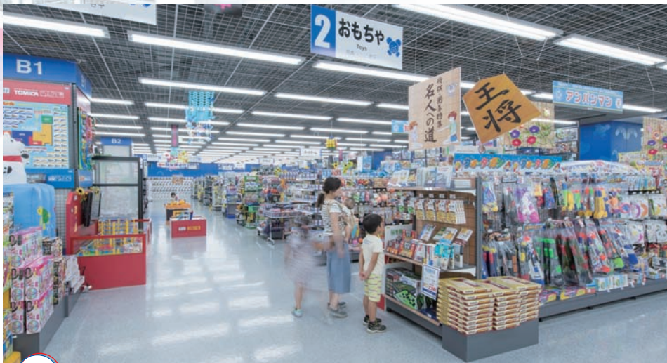
LABI1 ゲーム・おもちゃフロア