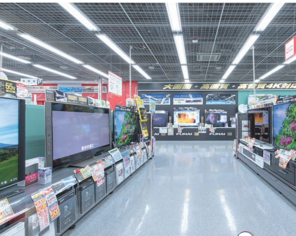
LABI1 AV 機器コーナー

鮮やかな画像が映し出される最新の大型液晶テレビがずらりと並び、AV (audio visual) 機器コーナー。その華やいだ雰囲気はまるで家電の