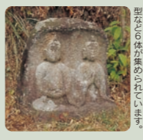
長井の道祖神 百原申の跡にあって、元禄の型な石が集められている。