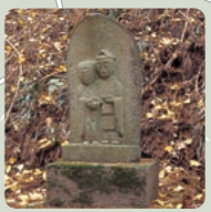
下諏訪神社の道祖神 彫刻としても素晴らしい。かえりかえり人を驚かします。