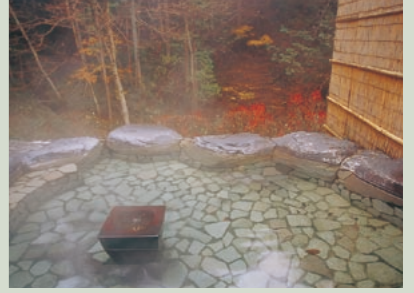
倉渚の隠れた名湯“美人の湯” 亀沢温泉