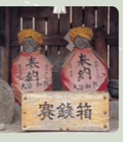
猪毛の道祖神 男神と女神が別石に刻まれ、病を治すとして信仰も厚い。万

道祖神 美しい山並みを眺めながら、川のせせらぎを聞きながら、倉渚町の道祖神巡りをしてみませんか。