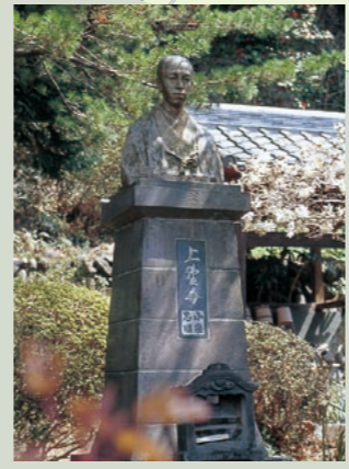
顕彰慰霊碑 水沼川原にある碑には「偉人小栗上野介 無くして此処に斬らる」と刻まれています。

クラインガルテン 概要 施設/市民農園(約200区画) ログハウス(4人棟6棟) くらぶち相間川温泉 ふれあい館 (天然温泉浴場、食堂、休憩室) 問合せ TEL 027-378-3834 http://www12.ocn.ne.jp/~aimagawa/mt.html