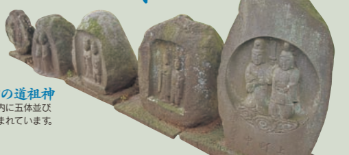
神明宮の道祖神 神明宮境内に五体並び、三ノ倉地区の人々に親しまれています。