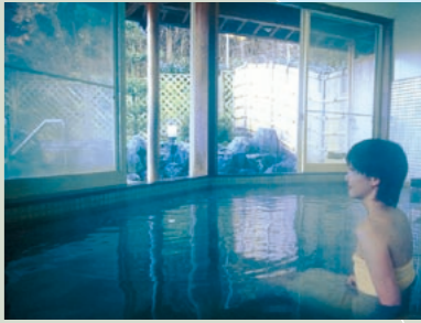
湯質、湯量、湯温と三拍子そろった天然温泉 相間川温泉