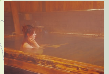
“自然がおいしい” 上州の秘湯 倉渚温泉