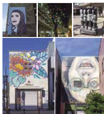
昨年のアートプロジェクトの展示作品

『高崎光のページェント』と同時期に開催。昼間はアート、夜はイルミネーションと装いの異なる演出が楽しめます。