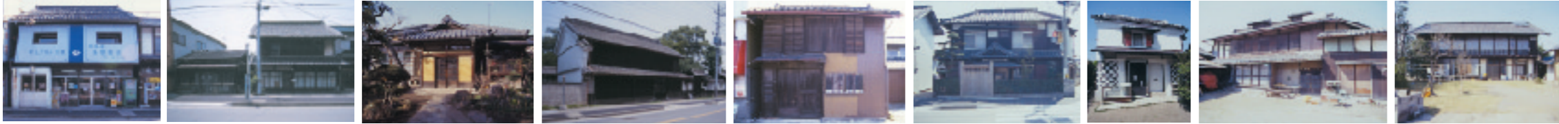
1 須永家 2 湯浅家 3 宮下家土蔵 4 真嶋家 5 鈴木家 6 須賀家 7 茂木家 8 筒井家 9 鳥羽家

一階の前面全てが開口部となっている。二階の屋根を出し桁で支え、棟も高い商家の造り。昭和八年(1933)の築造。