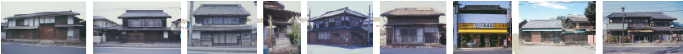
10 山茶庵 11 日置家 12 高橋家 13 飛田家 14 小黒商店 15 織茂家 16 堀口家 17 藤澤家屋敷稲荷 18 大山家 19 矢島家 20 平井家

19 矢島家 非公開 中山道に沿って町家の佇まいを残す主屋は、二階屋根を出し桁で支えるせがいで造り、和風の伝統的な要素が感じられる。以前、主屋東の下屋には土間があり、食事をとる座敷がもつけられていた。昭和十年代(1935~1944)の築造。