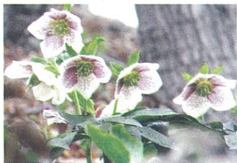
赤や紫のそばかすが入ったスポットは、うちのイチ押しです