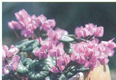
原種シクラメンのひとつ、コウム。ちっちゃい体なのに寒さにめっぽう強い!

花びらのように見えるのは実はガクで、赤や黒、ピンクに緑、紫、黄といろんな色があります。形はとがっていたり、丸かったり、ひらひらだったり。はたまた表ウラで違う色をしていたり。まん中も八重咲きになっていたり、赤いはん点があったり、緑がかっていたり。よく見ると、みーんな違う顔をしています。家庭でも意外に育てやすく、一度その魅力にはまるとあれこれコレクションしたくなりますよ。