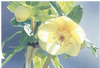
イギリスの名門ナーセリー(苗木の販売業者) アシュウッドを代表するゴールド