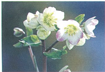
最新交配のブライヤーローズ。花弁先っぱの淡いピンクがキュート、見た目も斬新