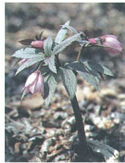
中国の山岳地帯に自生することが90年代にわかった伝説の花、チベタヌ。必見!