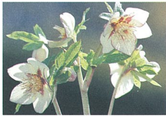
花弁の中央にかっこいいお星さま模様が入っているのがネオン