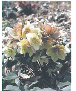
クリスマスローズの定番とも言える原種、ニゲル。ニゲル系にはニガーコルス(写真)やバラードニアエがあります