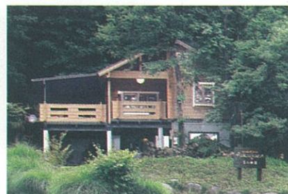
text: Mitsuko Iwai design: Hisashi Oida

イチゴメニューの提供は花のシーズンに合わせた1～3月 営業時間: 10:00～17:00(臨時休業有) 天神山登山口Pよりすぐ 【ご予約・お問い合わせ】 027-343-2706/090-2750-8626