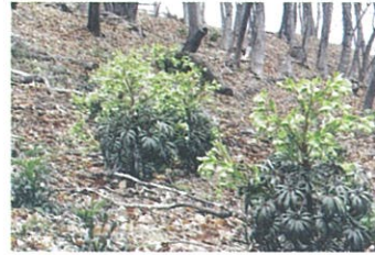
フラガールのようなユニークなシルエットのフェチダス。ほかに有茎種はアークチフォリウスやリヴィダスなど